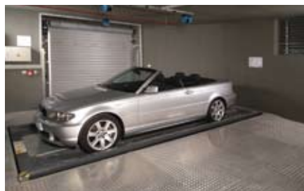
Dato che l'area di trasferimento è posizionata ad un'angolazione di 90° verso il livello di parcheggio, l'auto viene girata di 90°