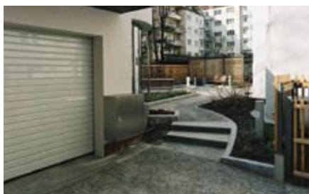
L'area di trasferimento delle auto situata nel cortile completamente rinnovato è perfettamente integrata all'ambiente circostante ed occupa poco spazio.