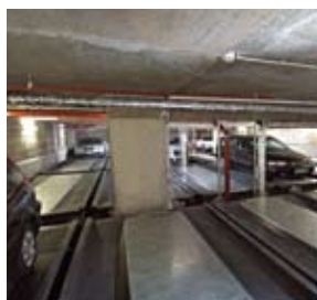
I posti auto sono posizionati in un sistema a 4 file una di fronte all'altra.