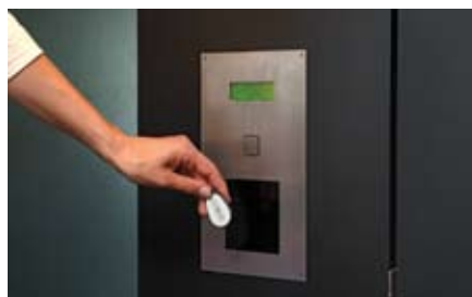
Alternativamente gli ospiti dell'hotel possono richiedere l'attivazione via citofono alla reception.