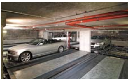
Una sequenza dura approssimativamente 28 secondi.