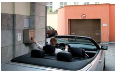
L'utente attiva la procedura di parcheggio tramite il suo chip induttivo al pannello di comando.