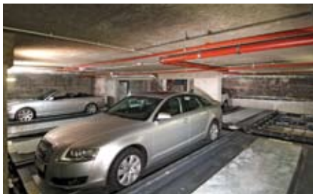
Viene fatta traslare verso l'elevatore con movimenti in sequenza