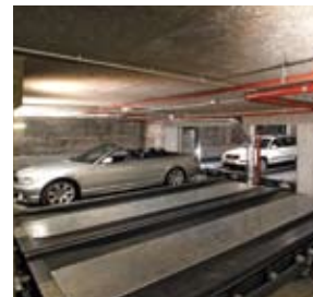
L'elevatore solleva la vettura e la porta al locale di ricevimento.