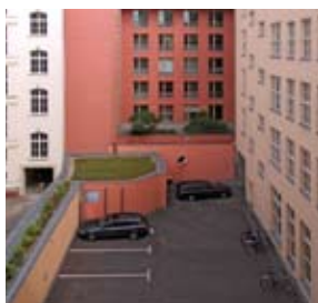
Sei posti auto convenzionali nel cortile posteriore dell'hotel.

Vi è solo un'area di trasferimento vetture al livello del cortile dalla quale l'auto viene trasportata attraverso un elevatore verticale al livello di parcheggio. Lo spostamento delle auto avviene in gruppo tramite una procedura di controllo ciclico con movimenti longitudinali e trasversali delle piattaforme richiedendo due posti vuoti nel sistema.