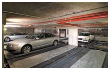
La Volkswagen bianca è stata selezionata per l'uscita.