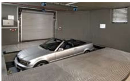
e poi viene fatta scendere.