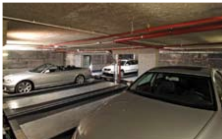
fino alla posizione dell'elevatore.