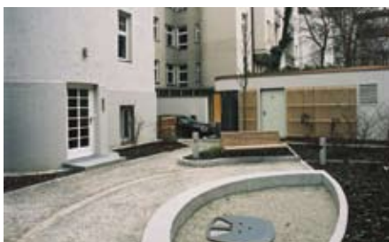
Immagine del cortile dove senza auto parcheggiate grazie al sistema Levelparker 590 i condomini hanno a disposizione un'area vivibile e libera.

L'applicazione di Monaco dimostra che la tecnologia non va a scapito delle ricchezze artistiche e culturali degli edifici dei centri città. Il Levelparker 590 in particolare può trovare ampie possibilità di installazione nei centri storici in quanto può essere adattato con flessibilità a specifiche esigenze progettuali. I livelli di parcheggio possono essere da 1 a 5 mentre il numero delle auto da parcheggiare varia da 10 a 50.