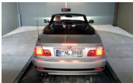
Scanner laser posti sul soffitto dell'area di trasferimento controllano il corretto posizionamento dell'auto.