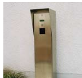
La selezione del posto auto avviene tramite chip induttivo al pannello di comando situato in prossimità dell'area di trasferimento.