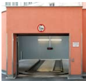
La porta si apre automaticamente e l'utente viene guidato da istruzioni su un display testuale.