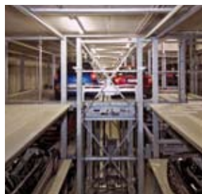
ed il pallet con l'auto viene traslato nell'unità di deposito e prelievo, posizionato e bloccato.