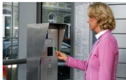
Per recuperare l'auto l'utente attiva la procedura di parcheggio tramite chip davanti al pannello di comando che, con l'utilizzo di un display, fornisce all'utente le istruzioni. Il personale via citofono gestisce il sistema di parcheggio 24 ore su 24.