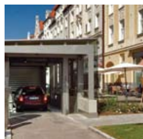
La porta si apre automaticamente ed il conducente viene guidato da delle istruzioni riportate su un display testuale.