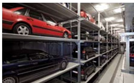
Un'immagine del Multiparker 740 con due file di pallet da entrambi i lati dell'unità di deposito e prelievo. Su quattro livelli sono parcheggiate 284 auto sotto la strada.

zona dove camminare e circolare. Il livello del rumore si è ridotto in quanto procedure come lo sbattere delle portiere delle auto e le manovre di parcheggio hanno luogo nelle aree di entrata del sistema. Piste ciclabili e marciapiedi prima utilizzati come posteggi ora sono libere per il passaggio e la sicurezza di ciclisti e pedoni. L'area di fronte agli edifici è stata trasformata e resa più attraente ed elegante con alberi, spazi verdi ed aree gioco. Il sistema di parcheggio sotto la strada ed i vantaggi portati hanno riqualificato il quartiere Neuhausen rendendolo una tranquilla zona residenziale e comoda zona di lavoro. A seguito di tale installazione Wohn Autoparksysteme ha condotto nel 2007 un'analisi sulla quantità di anidride carbonica presente nell'aria riscontrando una riduzione di 104 tonnellate di CO 2 in un anno. Questo sostanziale miglioramento è dovuto alla diminuzione dei gas di scarico delle auto alla ricerca di parcheggio e dalla movimentazione a motore spento che avviene all'interno dell'impianto.