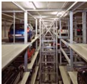
Il pallet con l'auto viene trasportato all'elevatore verticale e successivamente al livello di entrata.