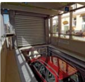
L'auto viene portata al livello -1 attraverso un ascensore verticale.