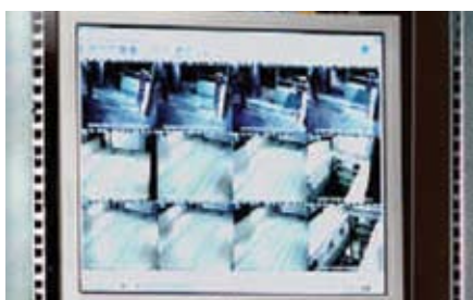
Le telecamere monitorano le aree di trasferimento e le zone di deposito ed il personale che gestisce il sistema assiste l'utente in caso di emergenza.