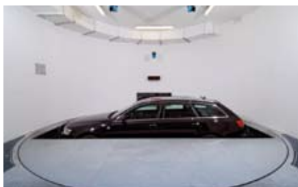
Dopo che l'auto è stata parcheggiata e la corretta posizione verificata da scanner laser, la vettura viene girata di 90° dalla piattaforma rotante