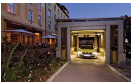
Entrambe le porte (di entrata e di uscita) si aprono per permettere all'utente di raggiungere l'auto e di uscire dall'area di trasferimento.