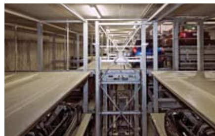
Mentre l'auto viene portata al livello inferiore dall'ascensore, l'unità di deposito si avvicina a questo, i due pallet si uniscono.