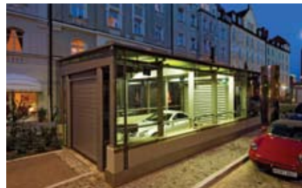
Una volta che il pallet raggiunge l'area di entrata quest'ultima si illumina per circa 2 minuti per dare all'utente la sensazione di sicurezza.