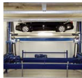
e portata al livello -1 da un elevatore verticale separato.