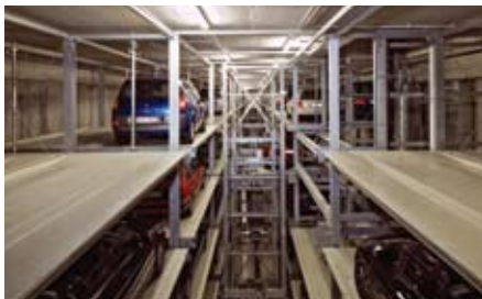
Le unità di deposito e prelievo eseguono i movimenti X, Y e Z verso il pallet prenotato con l'auto parcheggiata sopra e la portano fuori dalla scaffalatura.