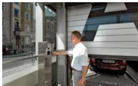
L'utente conferma la procedura di parcheggio al pannello di comando, la porta si chiude e gli scanner laser al soffitto nell'area di entrata controllano la posizione corretta della vettura.