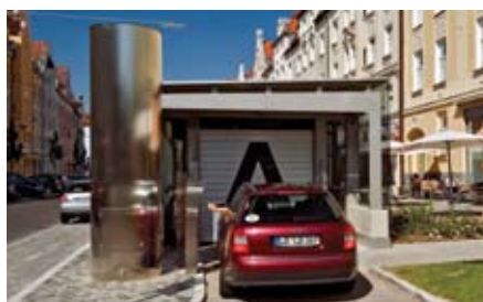
Le aree di entrata (A, B, C e D) sono accessibili a livello strada. L'utente attiva la procedura di parcheggio con il proprio chip induttivo al pannello di comando posizionato di fronte all'area di entrata.