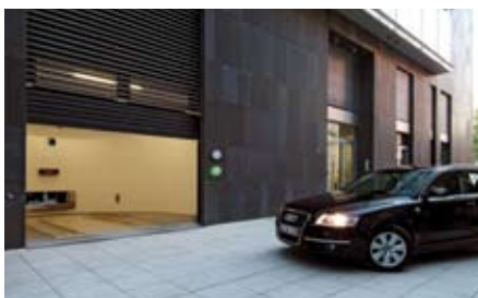
L'area di trasferimento è accessibile dal livello strada.

di parcheggio con il proprio telecomando, la porta si apre, l'utente posiziona l'auto su un pallet in un'area di trasferimento illuminata, aiutato durante la manovra da un display e da un grande specchio posteriore. Dopo l'uscita dell'utente dall'area di trasferimento, la porta si chiude e la procedura di parcheggio procede automaticamente. L'utente ritira l'auto richiedendola al pannello di comando attraverso il proprio chip. L'auto viene prelevata dalla griglia di deposito e trasportata all'area di trasferimento in direzione di uscita. La porta si apre e si richiude dopo la partenza dell'auto. Il sistema Multiparker è facile da utilizzare e sicuro per l'utente il quale ha la possibilità di parcheggiare la propria auto nel cuore della città lontano dal rischio di furto, multe o da atti di vandalismo.