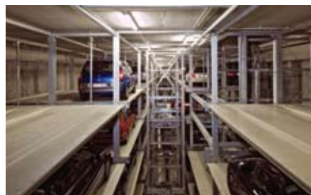
L'unità di deposito e prelievo muove il pallet con l'auto e lo trasporta attraverso i movimenti X, Y e Z allo spazio vuoto più vicino.